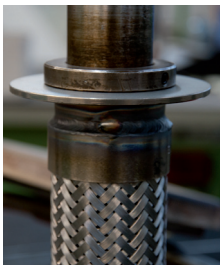
fertig geschweisster Schlauch Tuyau terminé