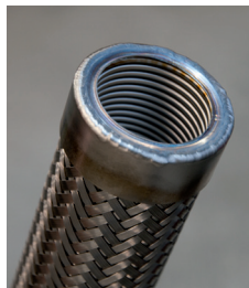
1. Schweissvorgang: Grundnaht Processus de soudage: cordon de base