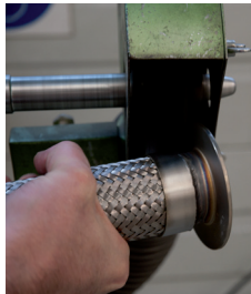
Polieren der Schweissnaht Polissage du cordon de soudure