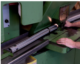
Zuschneiden / Coupe