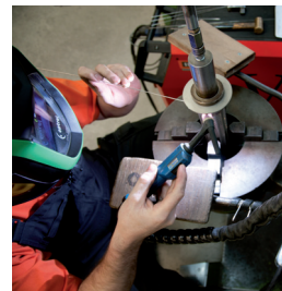
2. Schweissvorgang: Anschweissen der Armaturen Processus de soudage: soudure des armatures