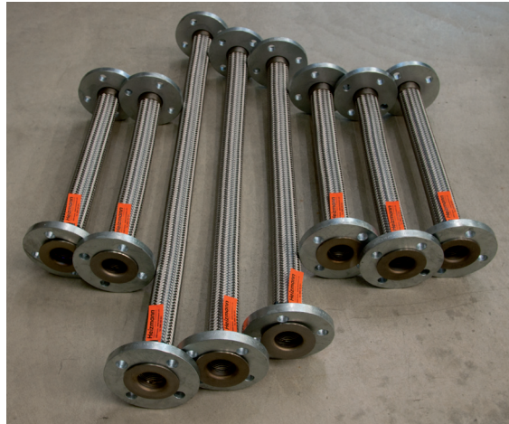
Konfektionierte Edelstahl-Schläuche / Tuyaux en acier inox confectionnés

Einzelstücke lieferbar innert 24 - 48 Stunden Pièces isolées livrables sous 24 - 48 heures